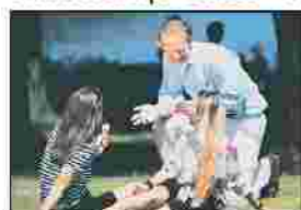
GAR NICHT SO EINFACH: Die meisten direkten Ansprachen scheitern - Frauen stehen sich auf der Straße

Ich bekomme fast immer einen Korb, wenn ich Frauen anspreche. Was mache ich falsch? Ich bekomme fast immer einen Korb, wenn ich Frauen anspreche. Was mache ich falsch?