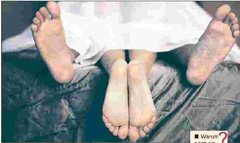
TRAUMFRAU GESUCHT: An jeder fünften Affäre entwickelt sich eine dauerhafte Beziehung - die beiden Wissenschaftler herausgefunden

Wie Männer sich die Single-Zeit vertreiben: Ein Affären-Ratgeber